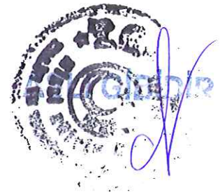
Nabi AVCI Millî Eğitim Bakanı